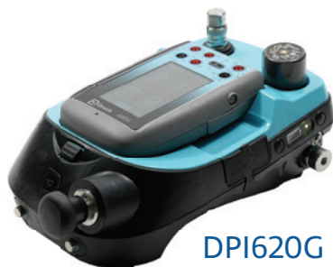
DPI620G + PV624