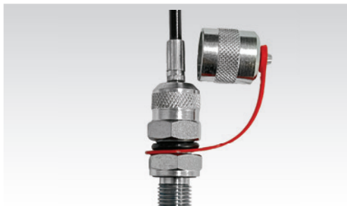
Adaptador/Tomador A-TPR-00001 conectado à mangueira de alta pressão A-MG-00003

Código de Encomenda: A-TPR-00002 Material: Corpo em aço carbono bicromatizado, o-rings em NBR/Perbunan®/BUNA-N® Pressão Máxima: 15 000 psi / 1 000 bar