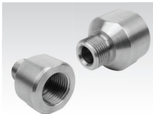
Adaptador Fêmea 1/2" BSP x Rosca IO-ADAPT-QF

Código de Encomenda: C-CN-00058 Material: Corpo em aço inox 316 (AISI 316) Pressão Máxima: 15 000 psi / 1 000 bar