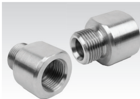
Adaptador Fêmea 3/8" BSP x Rosca IO-ADAPT-QF

Código de Encomenda: C-CN-00058 Material: Corpo em aço inox 316 (AISI 316) Pressão Máxima: 15 000 psi / 1 000 bar